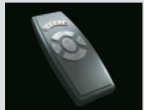
Mando a distancia (opcional)