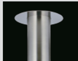
Embellecedor a techo incluido